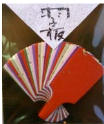
80007-3 No.7 羽子板