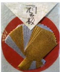
80019-6 No.19 羽子板(金銀)