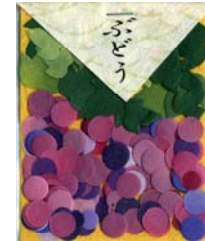
80042-4 No.42 ぶどう