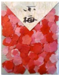
80001-1 No.1 小梅