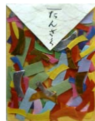
80041-7 No.41 たんざく