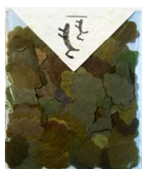
80025-7 No.25 もくもく