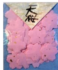
80021-9 No.21 大桜