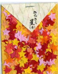
80045-5 No.45 きらきら星(赤)