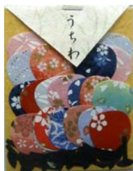
80033-2 No.33 うちわ