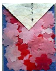
80038-7 No.38 さくら 中