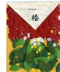
80048-6 No.48 椿