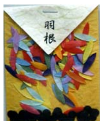
80037-0 No.37 羽根