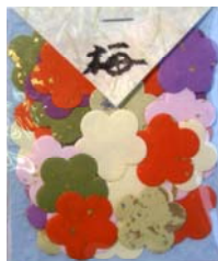
80020-2 No.20 大梅