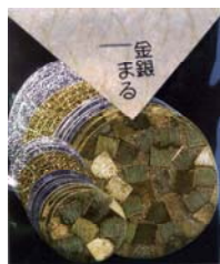
80026-4 No.26 金銀まる