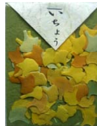
80035-6 No.35 いちよう