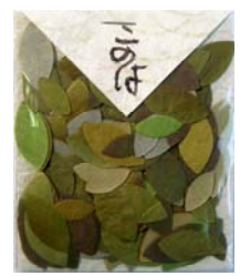
80006-6 No.6 このは