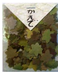
80004-2 No.4 かえで