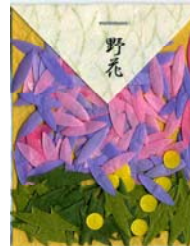
80047-9 No.47 野花