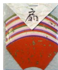
80011-0 No.11 扇