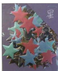
80009-7 No.9 星