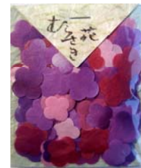
80017-2 No.17 むらさき花