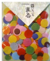
80027-1 No.27 いろいろまる