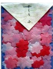
80039-4 No.39 さくら 小