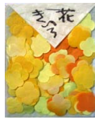
80016-5 No.16 きいろ花