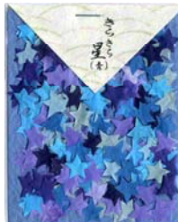
80046-2 No.46 きらきら星(青)