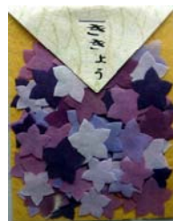
80034-9 No.34 きぎょう