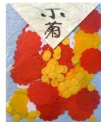
80022-6 No.22 小菊