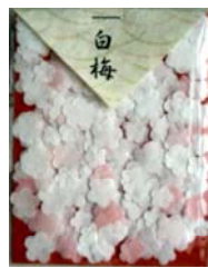
80040-0 No.40 白梅