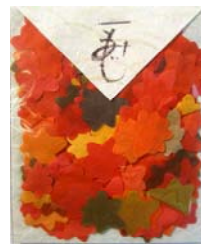
80005-9 No.5 もみじ