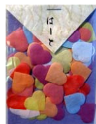
80030-1 No.30 はーと