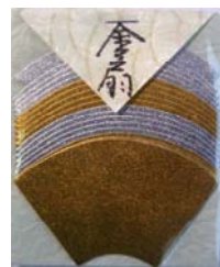
80015-8 No.15 金扇