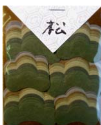
80008-0 No.8 松