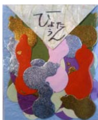
80032-5 No.32 ひょうたん