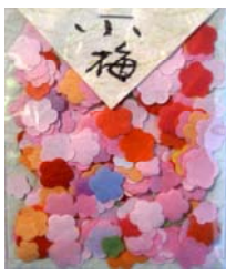
80002-8 No.2 小梅(多色)