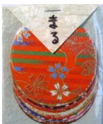
80013-4 No.13 まる