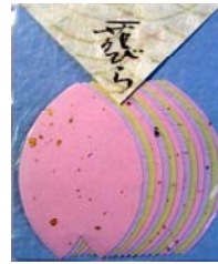
80023-3 No.23 花びら