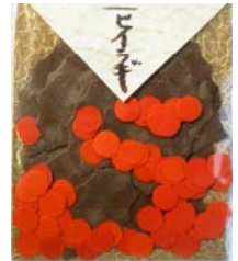
80024-0 No.24 ヒイラギ