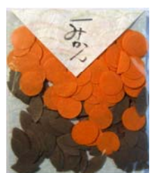
80012-7 No.12 みかん