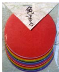
80014-1 No.14 色まる