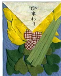
80044-8 No.44 ひまわり