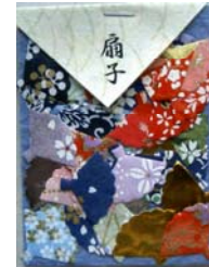
80036-3 No.36 扇子