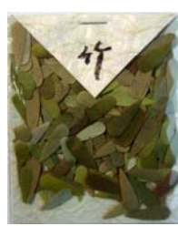
80010-3 No.10 竹