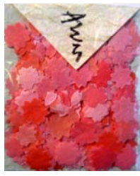
80003-5 No.3 さくら