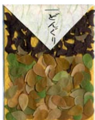
80043-1 No.43 どんぐり