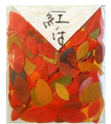
80018-9 No.18 紅ノ梅