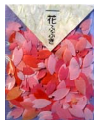
80029-5 No.29 花ふぶき