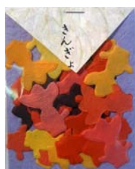
80031-8 No.31 きんぎょ